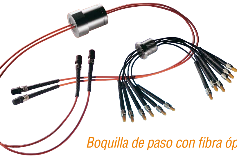
Boquilla de paso con fibra óptica